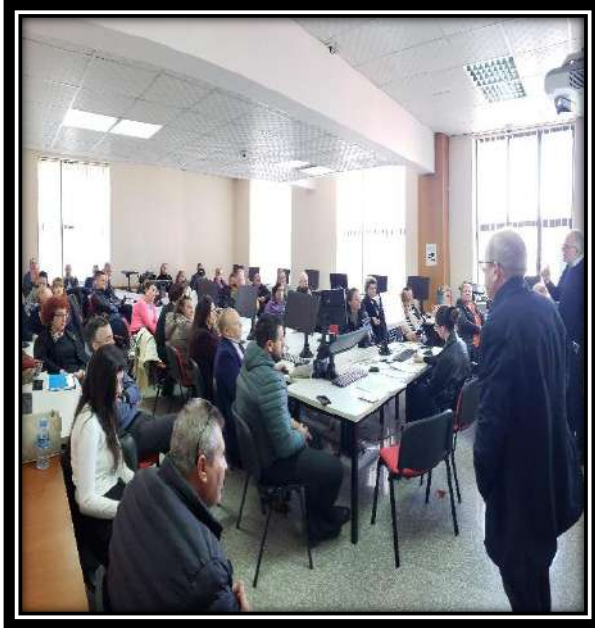
Foto nga trajnimet me punonjësit vazhdues të administratës tatimore