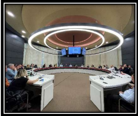
Foto nga trajnimet me punonjësit niveli bazë të administratës doganore