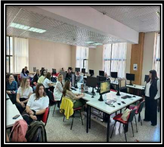
Foto nga trajnimet me punonjësit e rinj të administratës tatimore