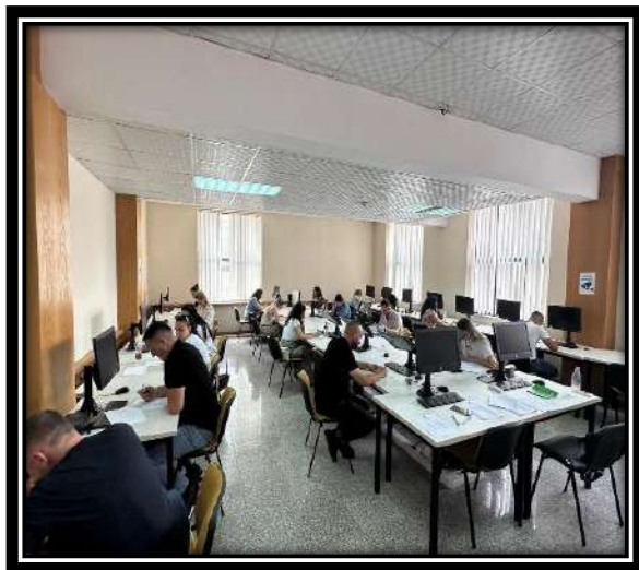
Foto nga testimi.