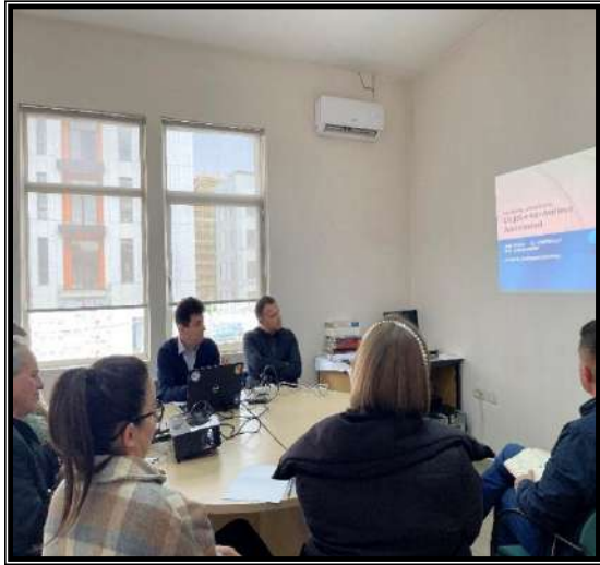
Foto nga trajnimet me punonjësit funksional të administratës doganore