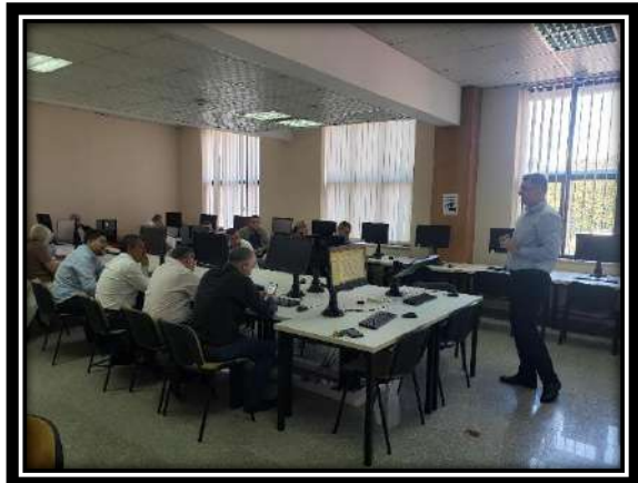
Foto nga trajnimet me punonjësit e nivelit funksional të administratës tatimore