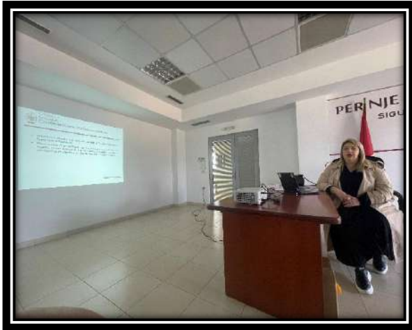
Foto nga trajnimet me punonjësit vazhdues të administratës doganore