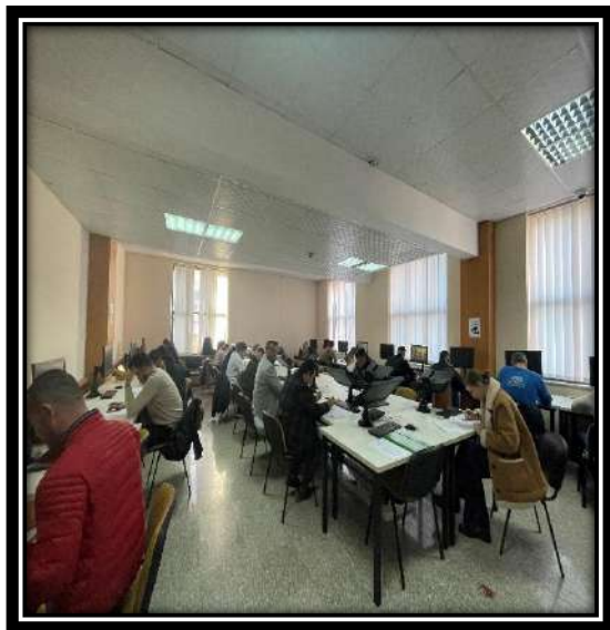
Foto nga testimi.